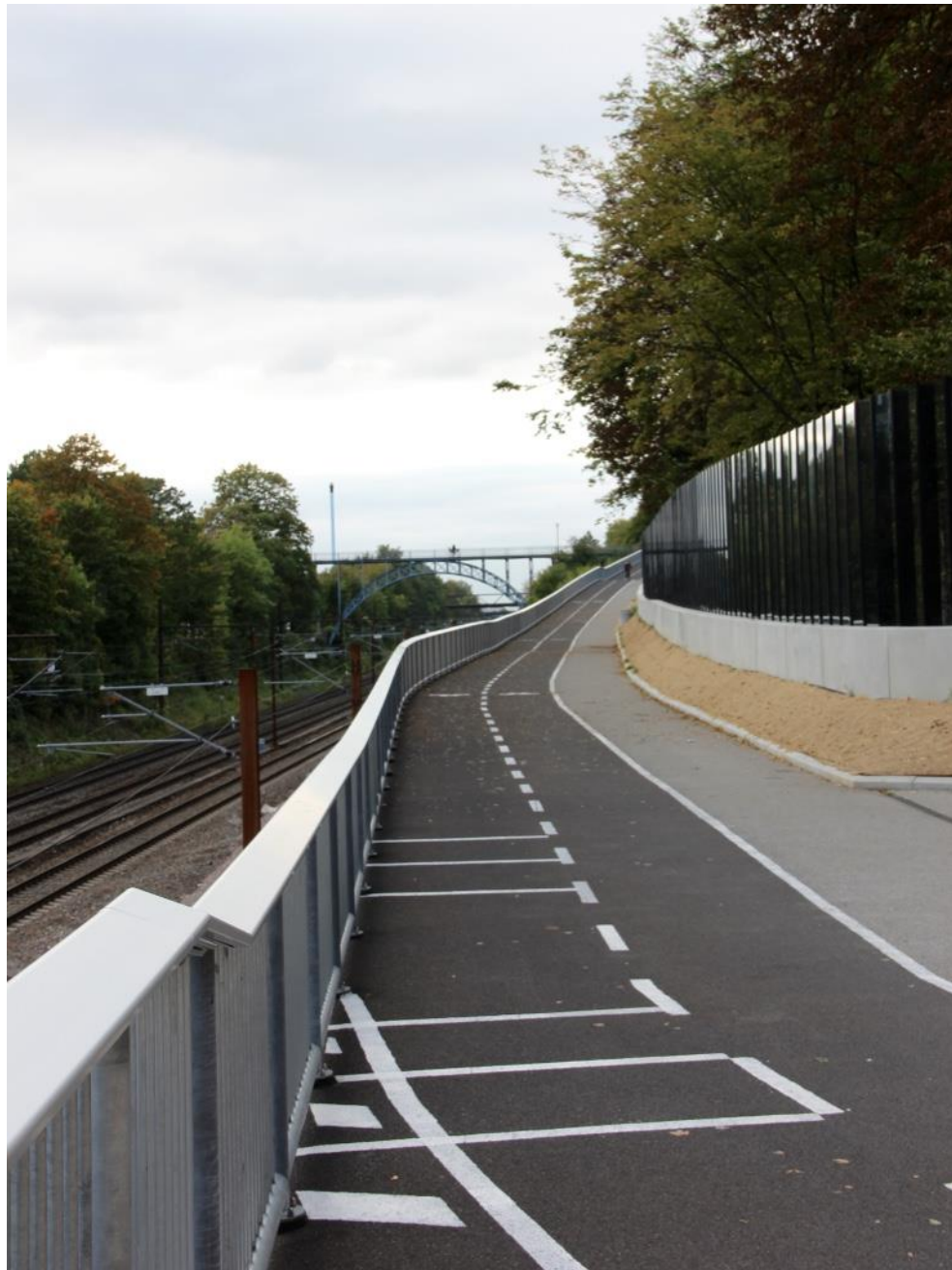
Den nye supercykelsti forbinder Carlsberg Station med Valby.